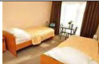
2-местный 1 корпус